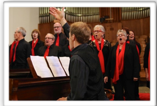
Benefizkonzert Gospelchor Allschwil