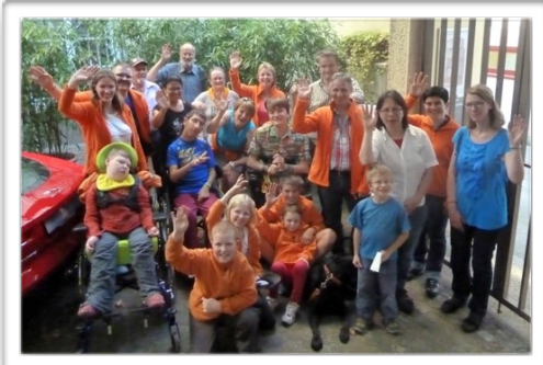
BGG Sternmarsch Basel, intensiv-kids Teamfoto

Zum 2. Mal wurden wir von der Basler Guggen Gemeinschaft BGG als Spende-Empfänger berücksichtigt. Diesmal wurde bei schönstem Wetter mit der BGG-Guggen die Basler Innenstadt unsicher gemacht. Am Abend gab es für unsere Mitglieder, MitläuferInnen und HelferInnen einen feinen Apéro im Biergarten vom Volkshaus und ein feines Nachtessen im Restaurant.